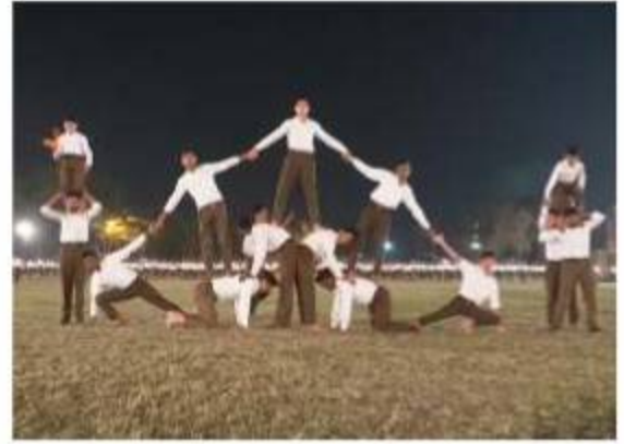
चितौड – शारीरिक प्रदर्शन