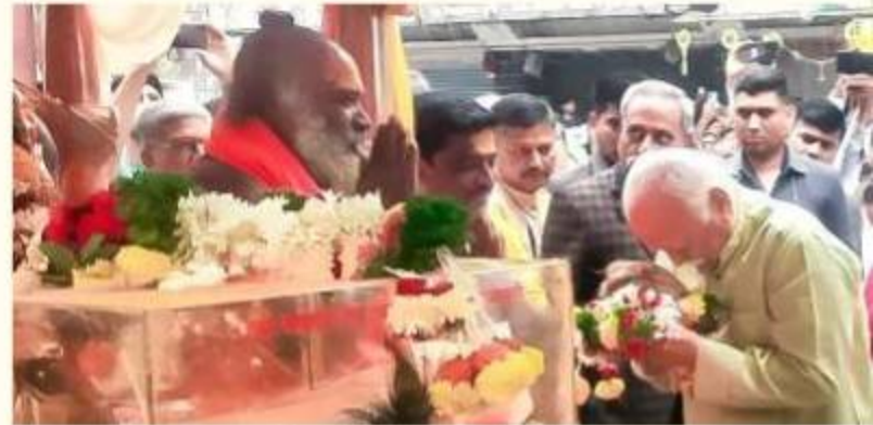
Darshan of Khandoba Yatra