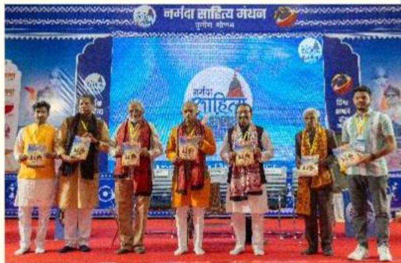
मालवा - निमाड की लोक कला, संस्कृति, देवता विशेषांक विमोचन

आंध्र प्रदेश व तेलंगाना में तेलगु साप्ताहिक जागृति के रामलला प्राण-प्रतिष्ठा विशेषांक की 4.5 लाख से अधिक प्रतियों की बिक्री हुई।