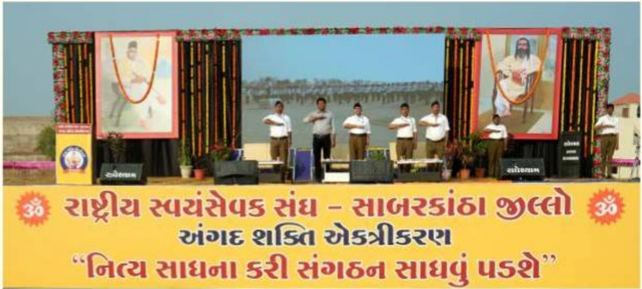
गुजरात - साबरकांठा जिला एकत्रीकरण

2) अखिल भारतीय प्रहार महायज्ञ - 16 दिसंबर 2023 - सहभागी शाखा - 42,455, मिलन - 6,885, स्वयंसेवक - 6,53,165। प्रहार - 32,66,22,149 । 1000 से अधिक प्रहार लगाने वाले 1,32,783 । गत वर्ष की तुलना में बढ़ोतरी - शाखा - 3309, मिलन - 217, स्वयंसेवक - 62,756 तथा प्रहार - 3,42,55,411 ।