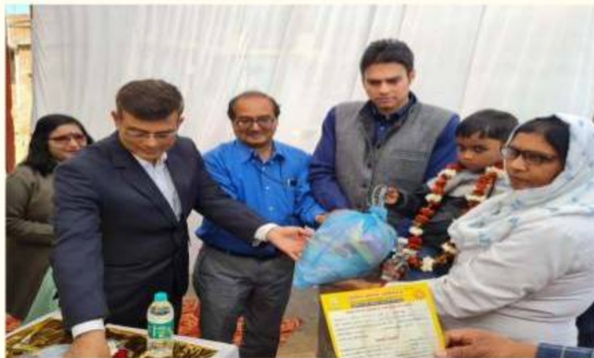
Mahakaushal - Providing Nutritional Kit to malnourished children

Madhya Bang - 70 families of Radhanagar in Tarkeshwar District were found to be illiterate and economically disadvantaged. It is because of society oriented programmes of Netaji Subhas Vyavsayi Shakha, literacy levels in these families have greatly improved. Many have got jobs due to better education. Other prevailing issues and problems in the families were also resolved. The level of alcoholic addiction in the village has also reduced. At present, 20 farmers have adopted the practice of organic farming.