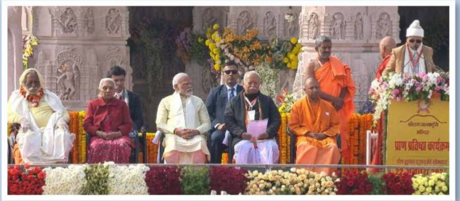
रामलला प्राणप्रतिष्ठा कार्यक्रम 22 जनवरी 2024, अयोध्या