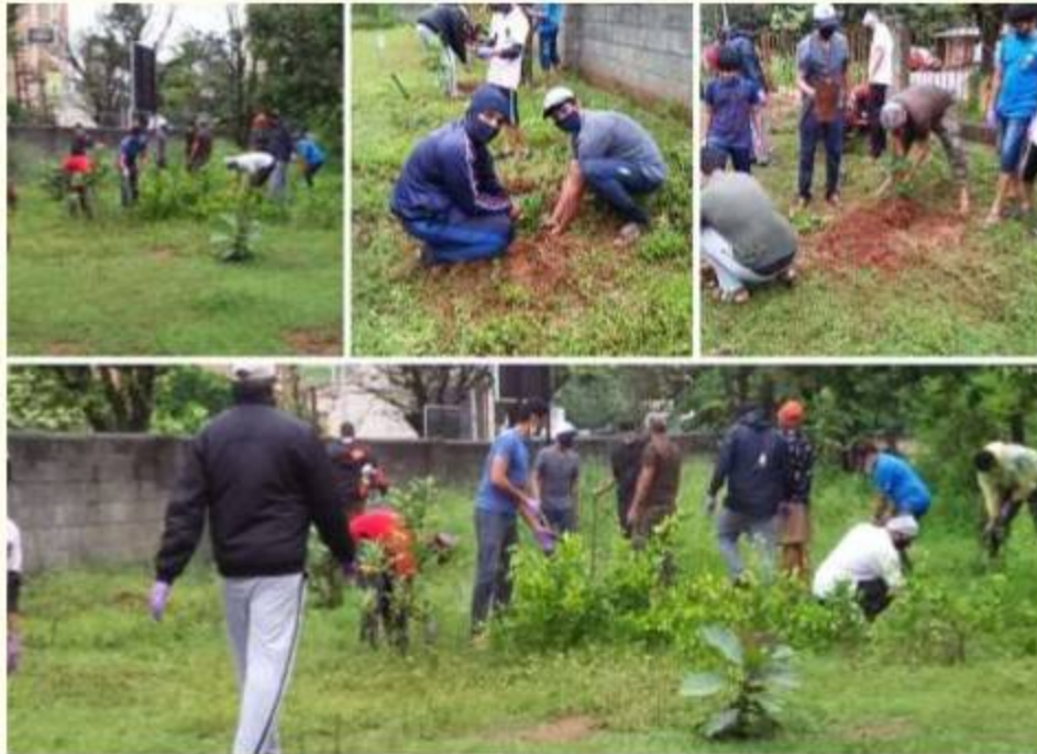
Karnataka Dakshin - Shakha Sewa Karya