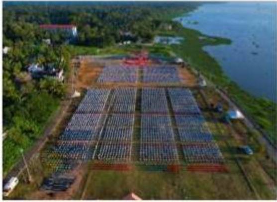
केरल – वायकोम सांघिक