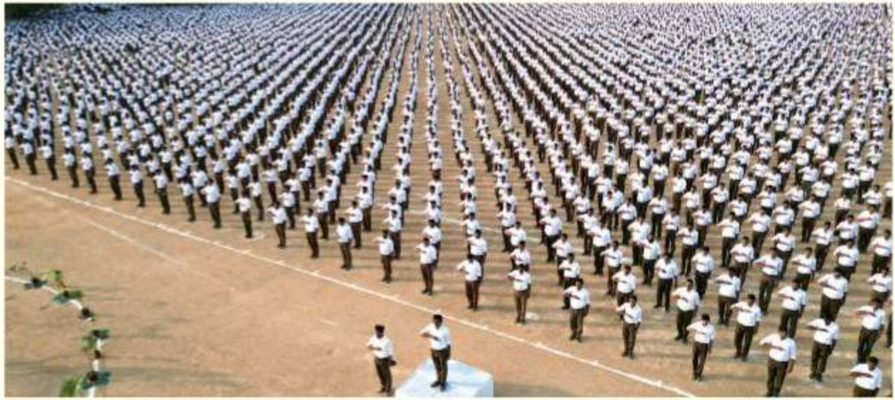
Saurashtra - Bhuj Ekatrikaran

• Akhil Bharatiya Prahar Mahayagya - 16 December 2023 - Participation - Shakhas 42,455, Milan 6,885, Swayamsevaks - 6,53,165. Prahar - 32,66,22,149. Swayamsevaks with more that 1000 Prahars 1,32,783. Increase compared to last year - Shakha - 3309, Milan - 215, Swayamsevaks - 62,756, Prahar - 3,42,55,411.