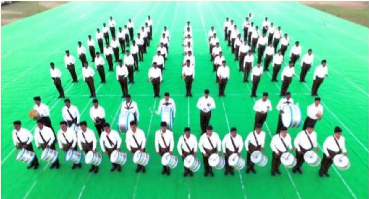
Telangana - "Swar Jhari" Ghosh Program

2) A 6 day Ghosh Camp was organised from 26 to 31 December, 2023 at Durgapur of Asansol district. A list of Swayamsevaks was prepared and practice was carried out for 2 months. 123 Karyakartas participated in camp. Mananiya Sarkaryawah Ji was present.