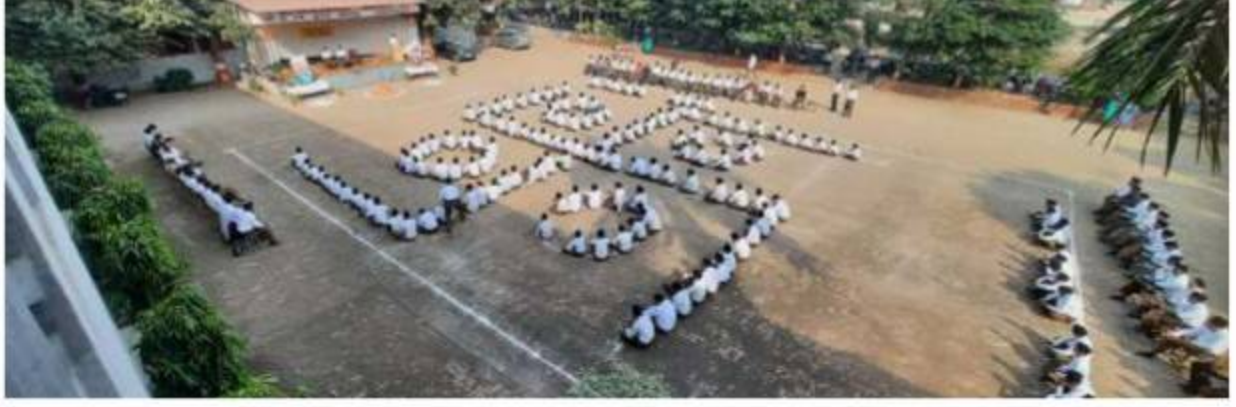
शाखा उत्सव – मेरठ प्रान्त