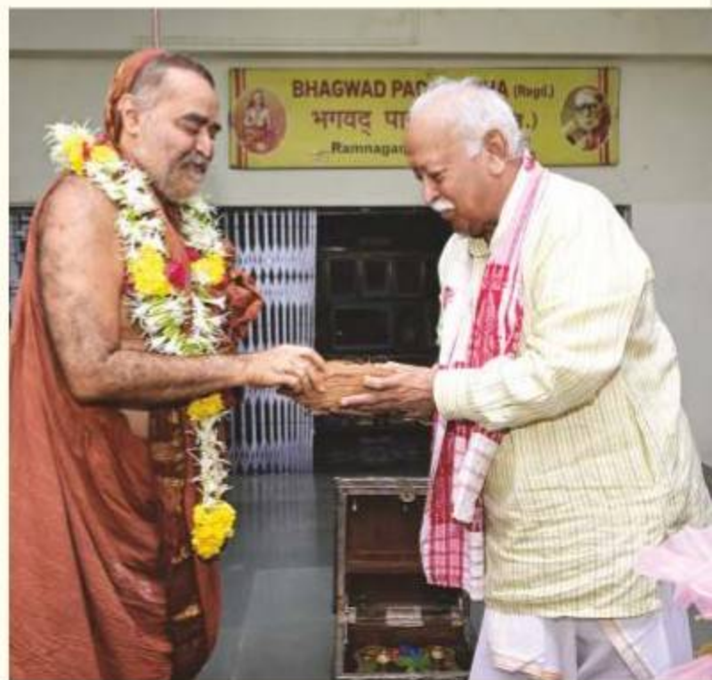
पूज्य शंकराचार्य विजयेन्द्र सरस्वती से आशीर्वाद प्राप्त करते हुए

● बैंकॉक, थाईलैन्ड में आयोजित वर्ल्ड हिन्दु कांग्रेस - 2023 का दिनांक 23 नवंबर 2023 को उद्घाटन किया।