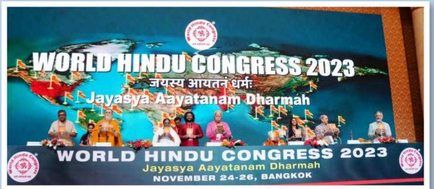
वर्ल्ड हिन्दू कॉंग्रेस - उद्घाटन समारंभ